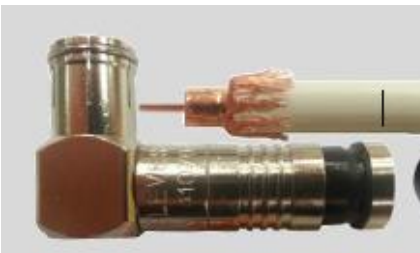
Fig. 2 - Descarnar o cabo, conforme as dimensões da fig. 3.