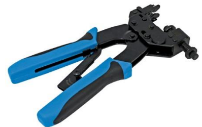
Fig. 6 – Ferramenta para cravação dos conectores (REF 0023820)