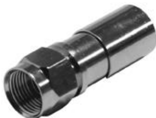
Fig. 7 – Conector de compressão recto (REF 0023551)