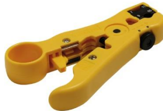
Fig. 5 – Ferramenta para descarnar (REF 0023830)