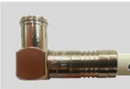
Fig. 4 – Insira o cabo no conector, até à marca e crave com uma ferramenta adequada.