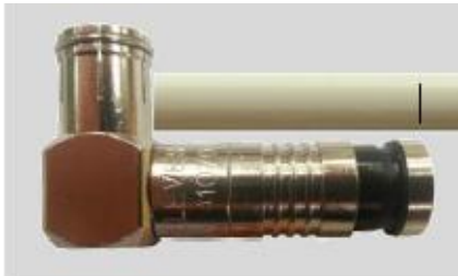
Fig.1 - Alinhar o conector (REF 0023550) com o cabo e marcar.